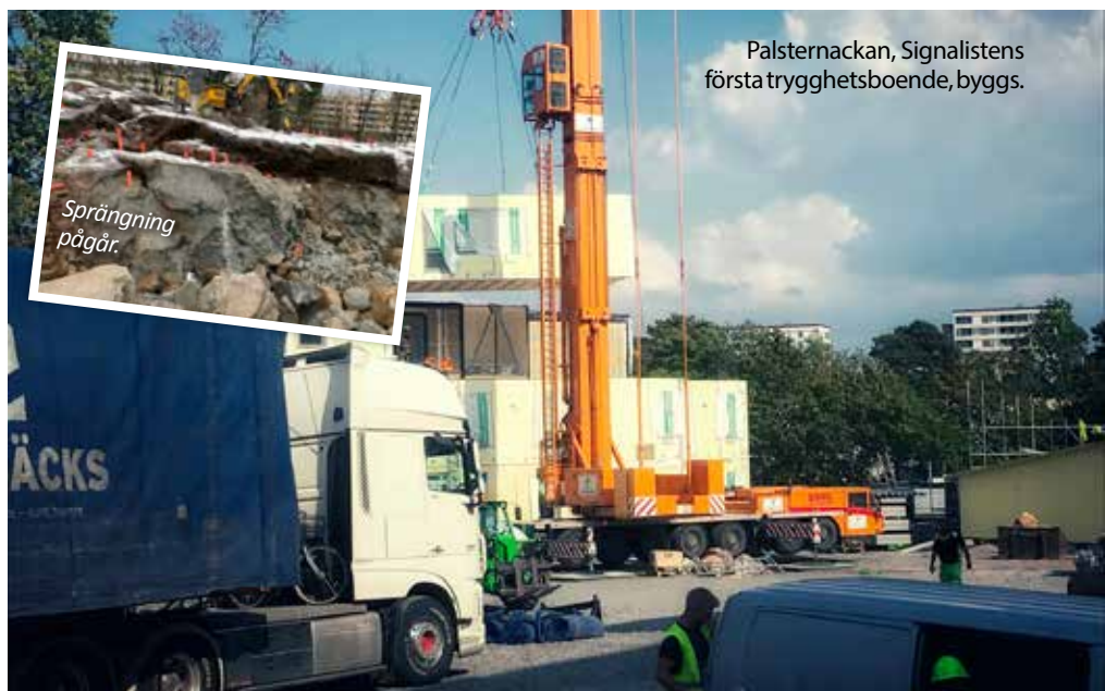
Palsternackan, Signalistens första trygghetsboende, byggs.

Under byggets gång bestäms också hyran tillsammans med Hyresgästföreningen.