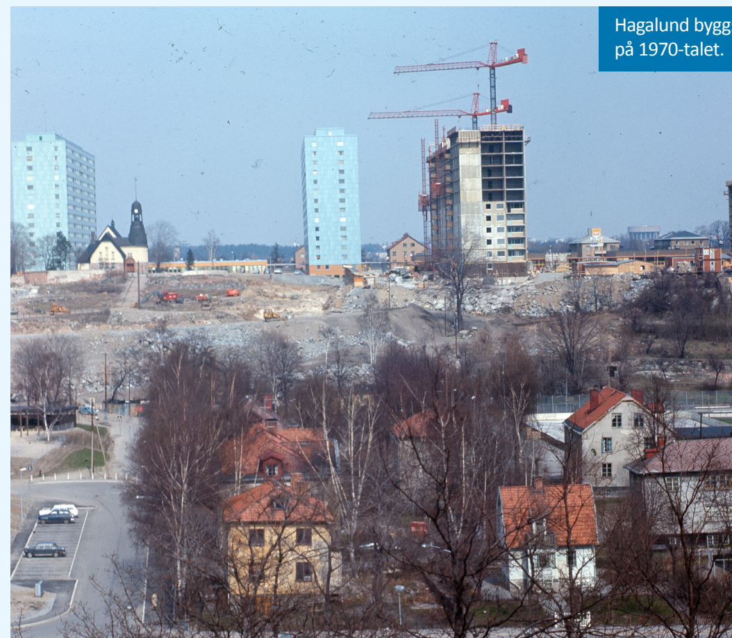
Hagalund byggs på 1970-talet.