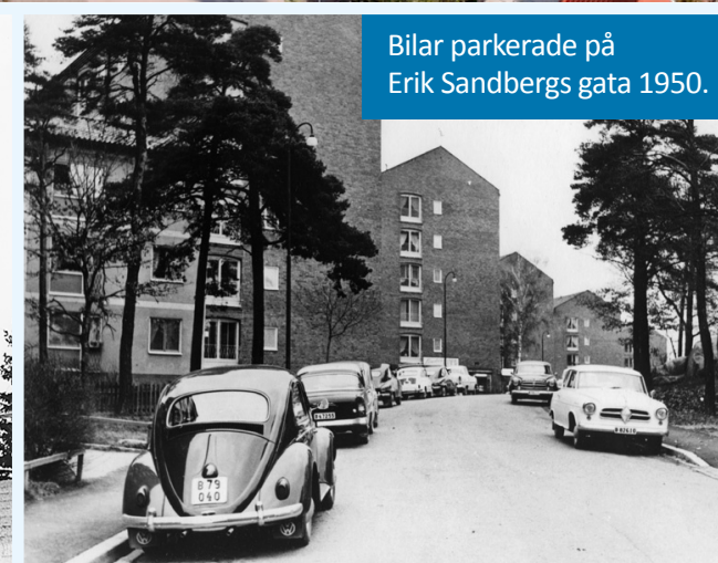
Bilar parkerade på Erik Sandbergs gata 1950.