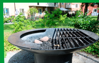
Signalistens grillplats i Frösunda.

Det är förbjudet att grilla på balkongerna på grund av brandrisk och störande os. Det gäller både vanlig grill och elgrill. Använd gärna Signalistens grillplatser.