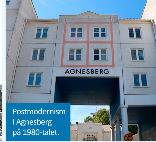
Postmodernism i Agnesberg på 1980-talet.