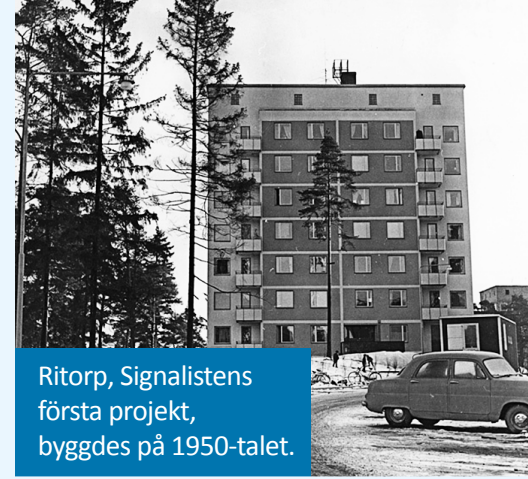
Ritorp, Signalistens första projekt, byggdes på 1950-talet.

1973 står det nya bostadsområdet i Hagalund färdigt i Bergshamrabyggens regi. Trots protester revs den gamla bebyggelsen och de karakteristiska blå höghusen restes. Området kallas Blåkulla och är i dag klassat som kulturmiljö av nationell betydelse, men har genom åren dragits med dåligt rykte och sociala problem. De första åren orsakas drygt hälften av underhållskostnaderna av vandalisering. Kalkylen för Bergshamrabyggen går inte ihop och bolaget är nära konkurs. För Signalisten är situationen omvänd då planerna och investeringen i