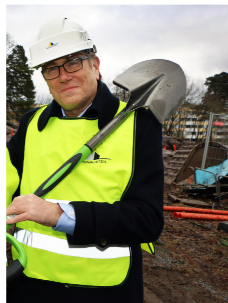
I januari byggstartade Palsternackan